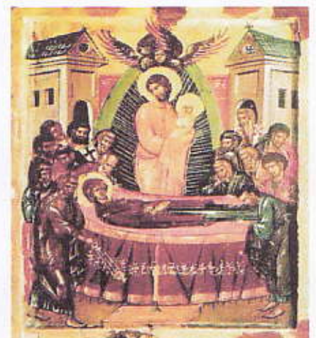
ADORMIREA MAICII DOMNULUI