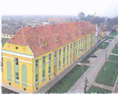
Școala cu clasele I-VIII Comloșu Mare