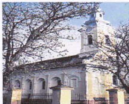
Biserica ortodoxă română din Comloșu Mare